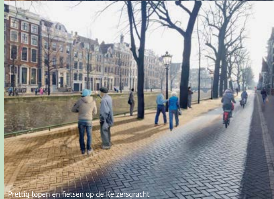
Prettig lopen en fietsen op de Keizersgracht