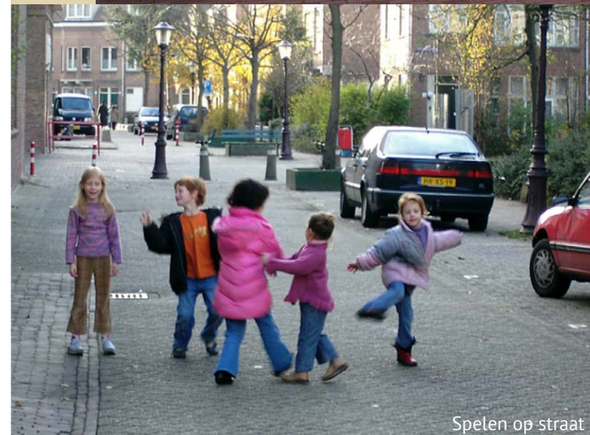
Spelen op straat